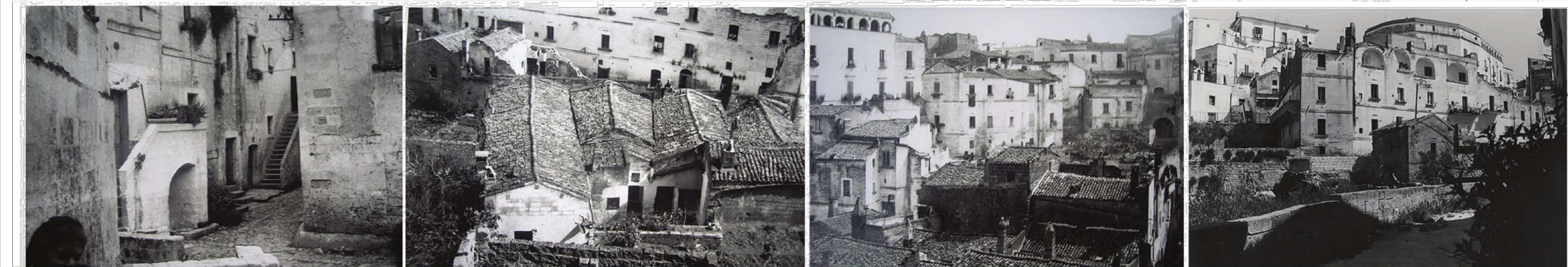
09 - Via Soccorso 10 - Veduta dall'altro da Belvedere Cattedrale 11 - Veduta dall'altro da Belvedere Cattedrale 03- Fontanino su Via Piaggio