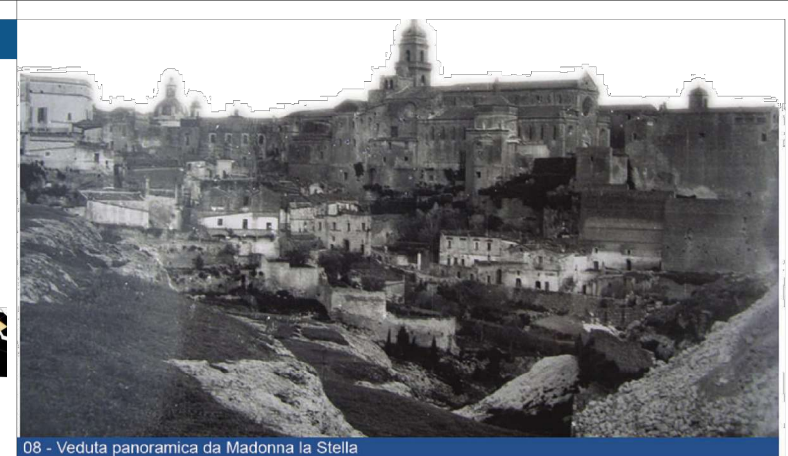
08 - Veduta panoramica da Madonna la Stella