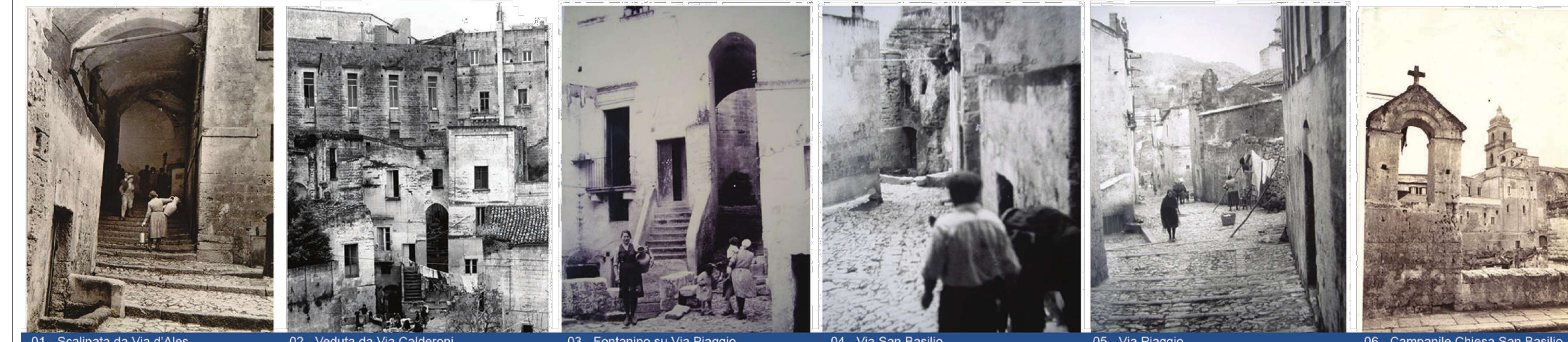
01 - Scalinata da Via d'Ales 02 - Veduta da Via Calderoni 03 - Fontanino su Via Piaggio 04 - Via San Basilio 05 - Via Piaggio 06 - Campanile Chiesa San Basilio